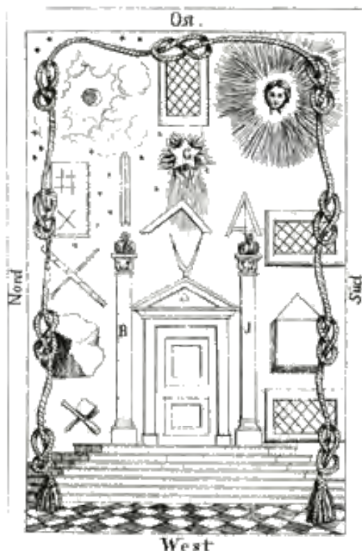
Cuadro de Logia. Grado compañero.

de suma importancia en la simbólica del grado de compañero (donde recibe el nombre de "estrella flameante"), y que los pitagóricos consideraban como su signo de reconocimiento y un emblema del hombre plenamente regenerado.