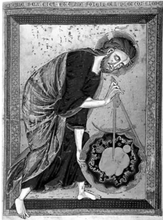
El Creador como geómetra y arquitecto Biblia francesa s.XIII

amoldarse a cualquier "dogma" religioso o exotérico sin entrar en conflicto con él.